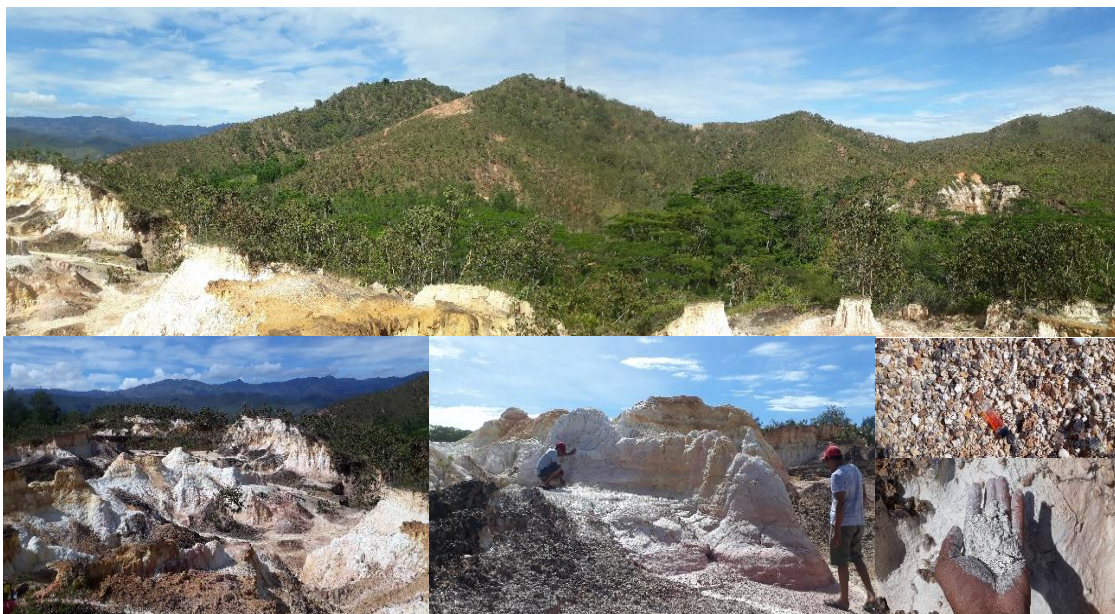
Figura 3. Distribusaun Mineral kaolinu iha terenu iha Municipiu Aileu.