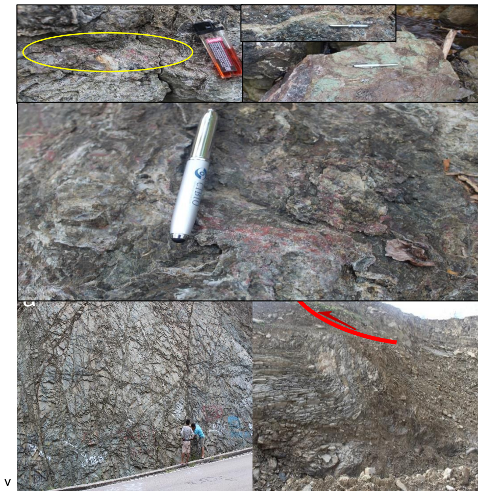
Figura 2. Indikasaun mineralizasaun iha fatuk volkaun alteradu nebe desconfia nudar mineral Cuprite ou Cinabar iha Municipiu Same.