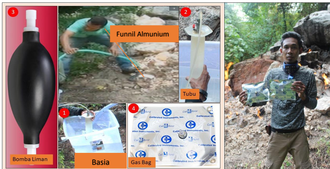
Figura 1. Prosesu utiliza ekipamentus ne'ebe uja hodi kolekta amostra gas ahi lakan: (1). Masa/Box (2). Tubu, (3). Bomba Liman, (4). Gas Bag, (5). Funil Almunium.

Alein de utiliza ekipamentus refere mos ekipa halo mos observasaun jeral ida kona ba jeolojia no rekursu mineral iha formasaun seluk li-liu Formasaun Barique, Formasaun Lolotoi no Formasaun Aileu balun hodi observa kona ba existensia indikasaun mineral hodi traca plano ba halo estudu kontinuasaun.